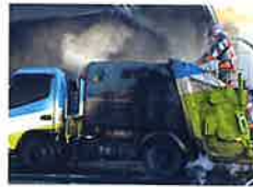
ごみ収集車の荷台での火災