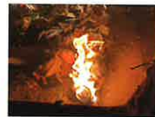
クリーンセンターのベルトコンベア上での火災